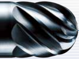
超硬ボールエンドミル